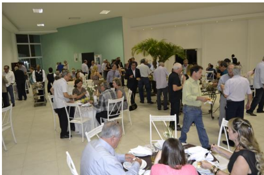
Área com capacidade para 350 pessoas