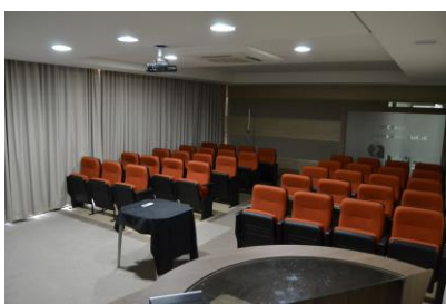
Auditório Dr. Rui Scavini

Aqui você pode reunir sua especialidade, realizar reuniões científicas e de outra natureza profissional.