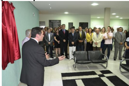
Hall de entrada