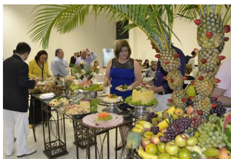
Serviço próprio de Buffet da casa do médico